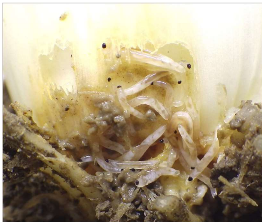
ネギを食害するネギネ幼虫

2014年これまで国内で未確認のネギネクロバネキノコバエ（以下ネギネ）による被害がネギおよびニンジンに発生しました。このため、国や大学と連携して研究を行いました。その結果、本種は中国のニラなどで発生しているものと同種であること、多く発生する時期や増えやすい条件などの特徴を明らかにしました。さらに、有効な農薬を選抜して、効果的な防除方法を組み立てました。これらの研究成果を活用して、生産者や市町村などと一体となって防除に取り組んだ結果、被害は非常に少なくなっています。現在は、さらに省力的に防除を行えるように、研究に取り組んでいます。