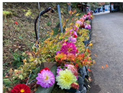
ダリアの飾り付け作業の様子