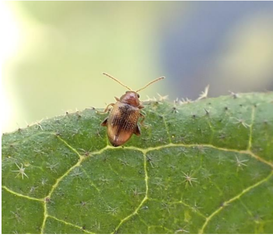
写真1 タバコノミハムシ成虫