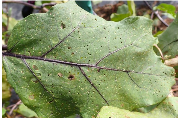
写真2 ナスの葉における食害痕