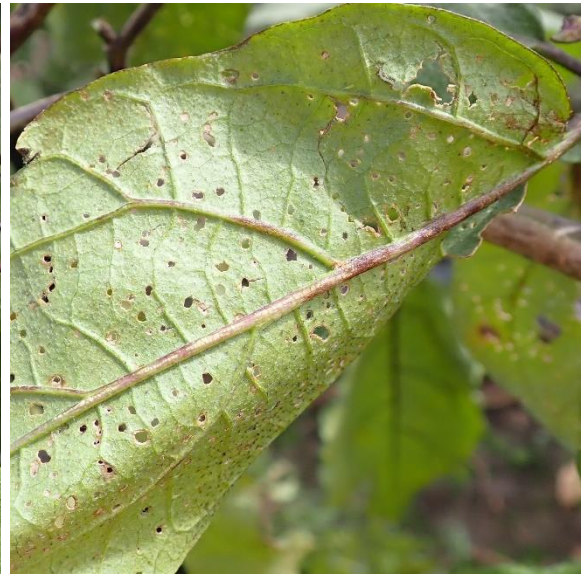
写真4 ナスの葉における食害痕（裏側）