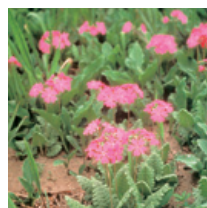
県の花「サクラソウ」