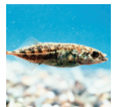
県の魚「ムサシトミヨ」