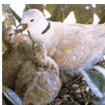
県民の鳥「シラコバト」