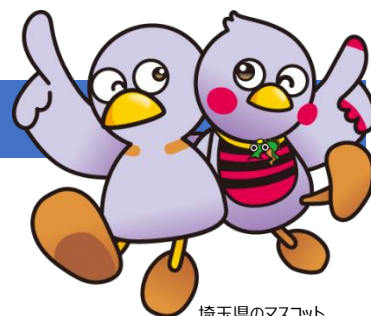
埼玉県のマスコット コバトン&さいたまっちゃん

https://www.pref.saitama.lg.jp/rihasen/annai/kenshu/sport-online.html