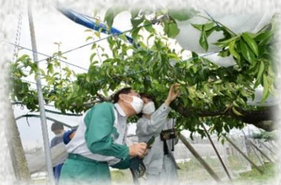
降ひょう被災地の現地視察