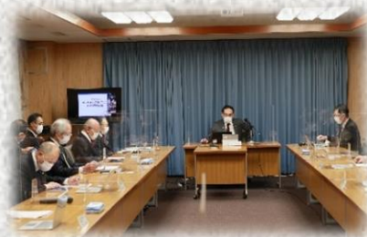
強い経済の構築に向けた埼玉県戦略会議