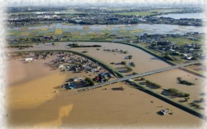
令和元年東日本台風で河川が氾濫（東松山市）