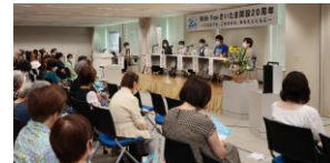
【多様なパネリストによるトークセッション】