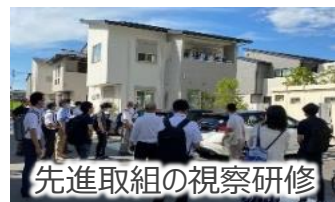
先駆取組の視察研修