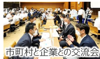
市町村と企業との交流会