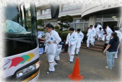
豚熱の防疫措置に向かう職員