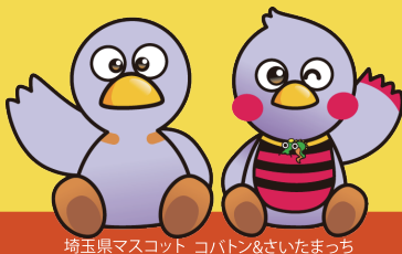
埼玉県マスコット コバトン&さいたまっちゃん