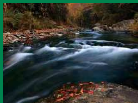
トラスト保全地の部 佳作「秋色の渓谷」(トラスト3号地)