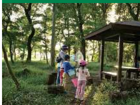
トラスト保全地の部 優良賞「森への窓口」(トラスト12号地)