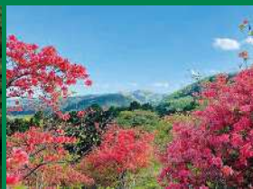
身近な緑の部 優良賞「天空のつつし」(寄居町)