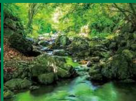
身近な緑の部 最優秀賞「新緑の清流」(寄居町)