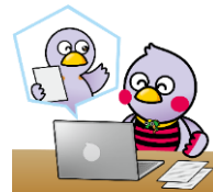
埼玉県のマスコット「コバトン」「さいたまっち」