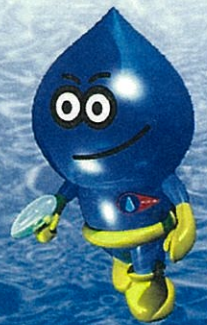
けんえいすいどう 県営水道マスコット ウオー太郎