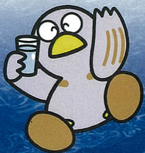
さいたまけん 埼玉県マスコット コバトン