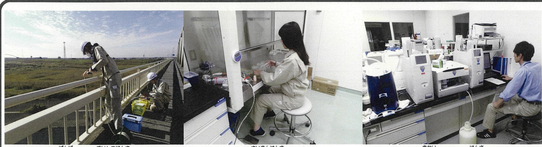
けんば すいじつけんさ ▲現場での水質検査 さいきんけんさ ▲細菌検査 きがい けんさ ▲機械による検査

学校のプール*約8,880杯分の水道水を1日で作れます。 ※たて25m、よこ12m、深さ1mの場合