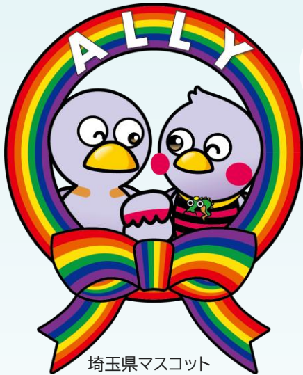
埼玉県マスコット コバトン&さいたまっち