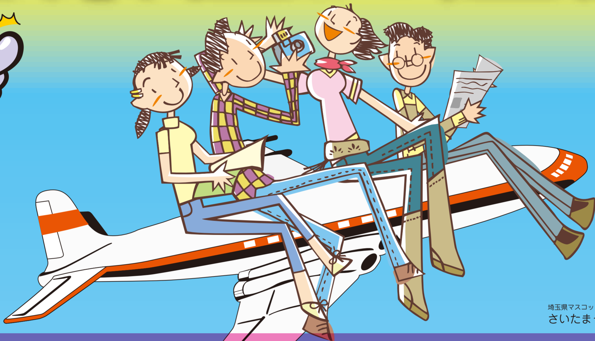
埼玉県マスコット さいたまっち