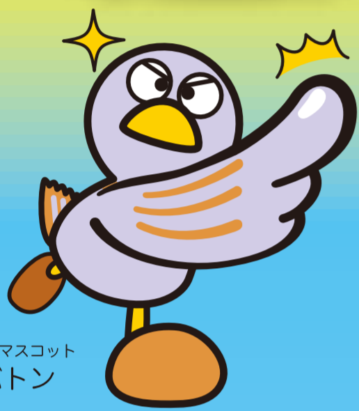
埼玉県マスコット コバトン