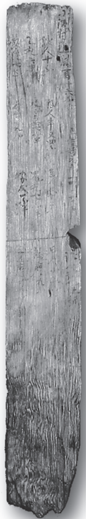
川口市・三ツ和遺跡