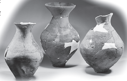
熊谷市・諏訪木遺跡