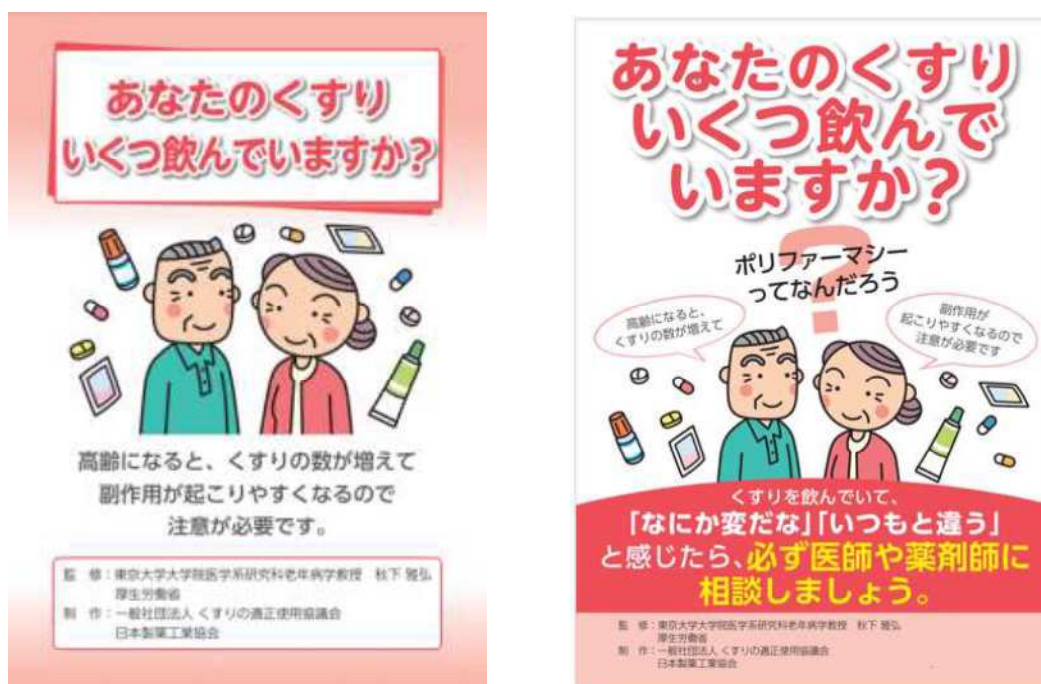
図1 一般社団法人くすりの適正使用協議会ウェブサイト「あなたのくすりいくつ飲んでいきますか」のパンフレット(図左)、ポスター(図右)のイメージ

https://www.rad-ar.or.jp/knowledge/post?slug=polymarmacy