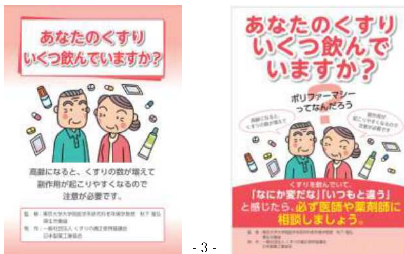
図1 一般社団法人くすりの適正使用協議会ウェブサイト「あなたのくすりいくつ飲んでいますか」のパンフレット(図左)、ポスター(図右)のイメージ

https://www.rad-aror.jp/knowledge/post?slug=polypharmacy