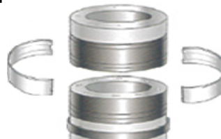
ペアリングジョイント