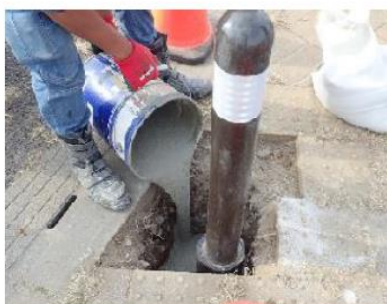
⑤ 無収縮モルタル打設