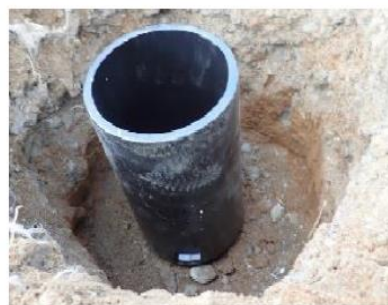
③ ヒノダクパイル打ち込み完了