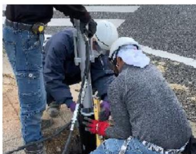
② ヒノダクパイル打ち込み