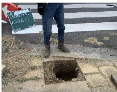
① 人力掘削 (□300×H400)