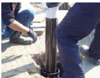
④ 高強度ポラード設置