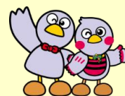
埼玉県のマスコット 「コバトン」「さいたまっち」

※ 交付決定後に対象となる取組を実施し、就業規則の作成又は改正を行う場合が対象となります。