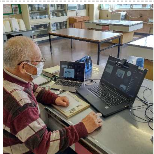
理科室より、チームズによる授業