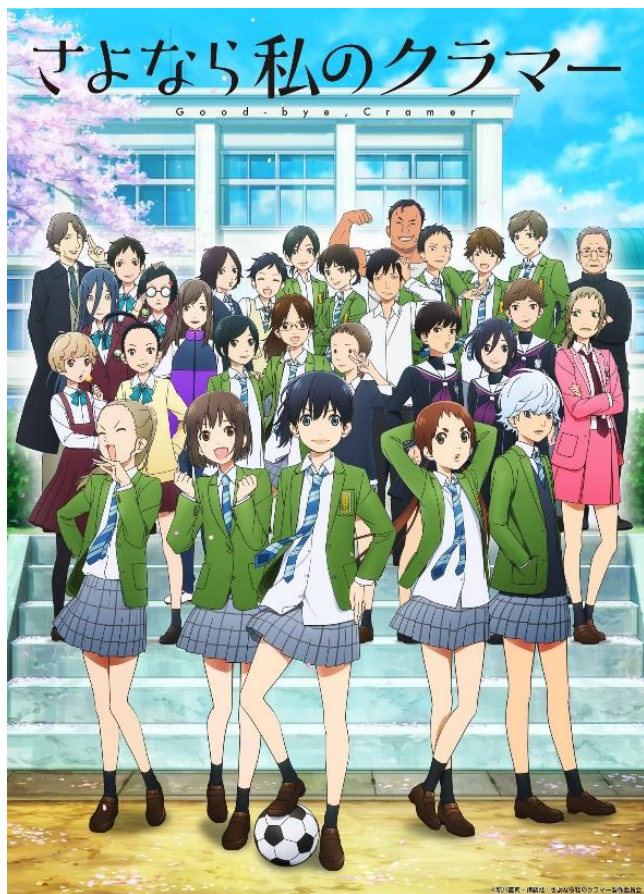
主人公・恩田希らが高校女子サッカーの頂点を目指す青春物語

市内事業者等と連携した商品開発や聖地認定を踏まえた市内巡りの充実、作品やWEリーグと連携したスポーツイベント等を開催する。