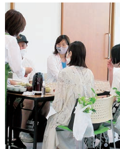
お茶の淹れ方教室