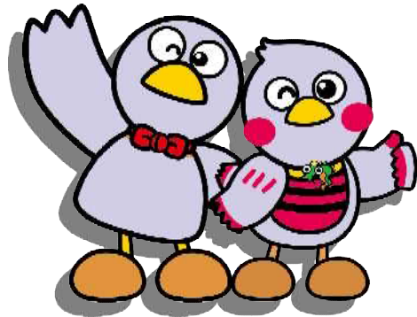
埼玉県マスコット 「コバトン」・「さいたまっち」