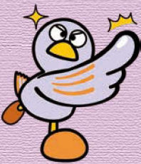
埼玉県マスコット「コバトン」