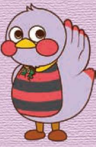
埼玉県マスコット「さいたまっち」