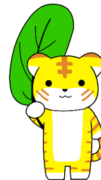
募金グッズ (干支のバッジ)