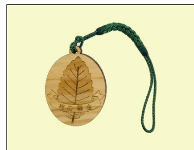
ストラップ (木製) (500円～)