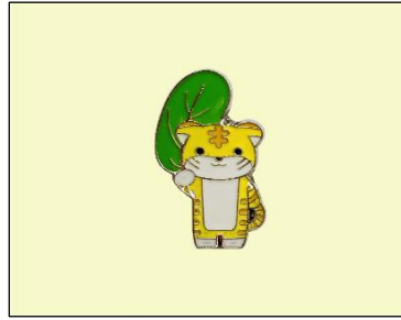
バッジ (干支、大) (400円～)