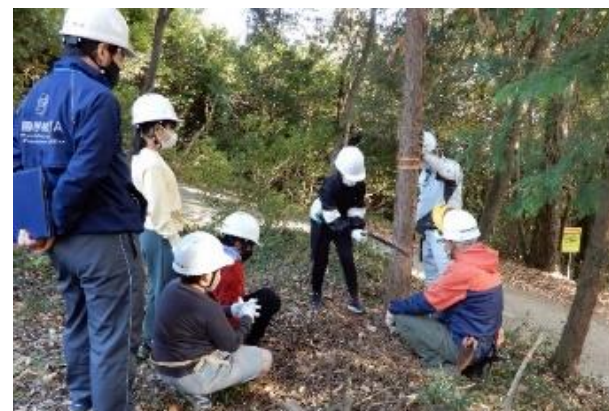
緑の少年団 活動の様子