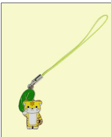
ストラップ (干支) (500円～)