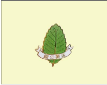
バッジ (葉っぱ) (500円～)