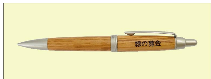
木製シャープペン (1,000円～)