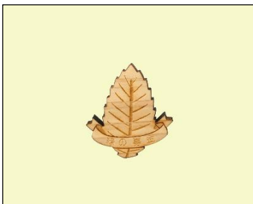
バッジ (木製、葉っぱ) (500円～)