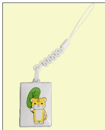
ストラップ (液晶クリーナー) (500円～)