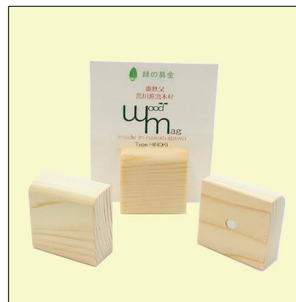
木製マグネット (500円～)