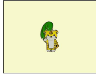
バッジ (干支、小) (300円～)