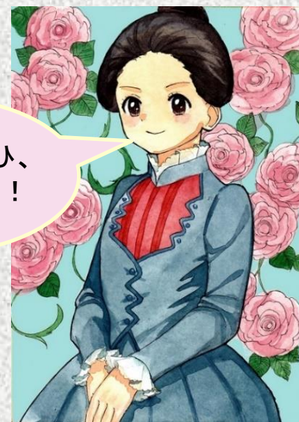
～日本で最初の公認女性医師～ 荻野 吟子