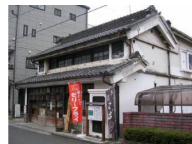
足袋蔵の保全・活用 (蕎麦屋の例)