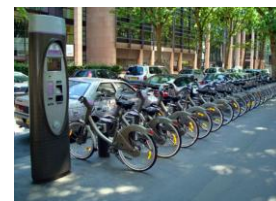
コミュニティサイクル (パリの例)