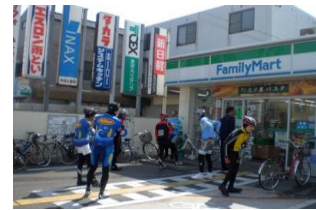
コンビニ等との連携