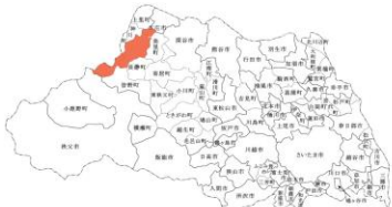
県内位置図 (平成18年2月1日現在)