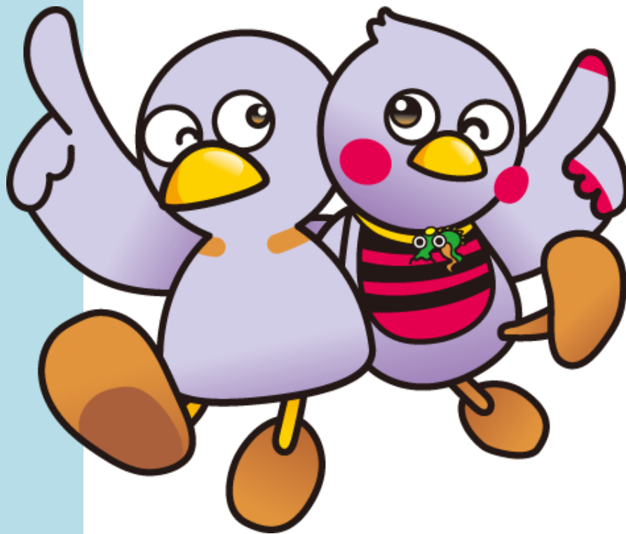
埼玉県のマスコット「コバトン」と「さいたまっち」