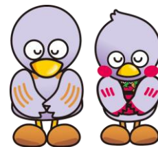
埼玉県のマスコット「コバトン」と「さいたまっち」