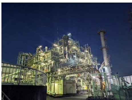
会場：元荒川水循環センター