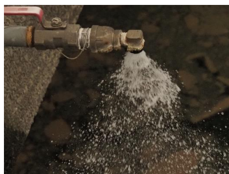
会場：荒川水循環センター