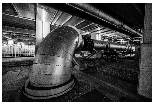
会場：荒川水循環センター