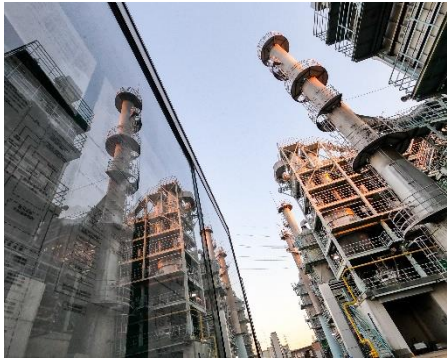
会場：新河岸川水循環センター