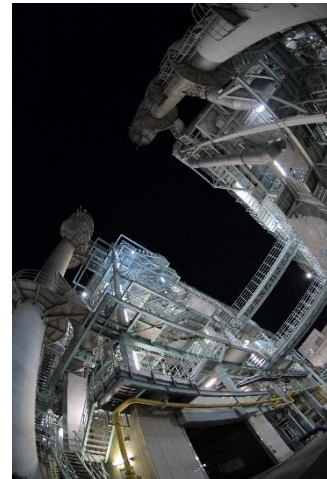
会場：新河岸川水循環センター