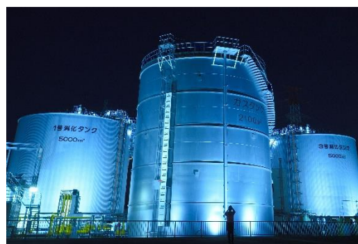
会場：元荒川水循環センター