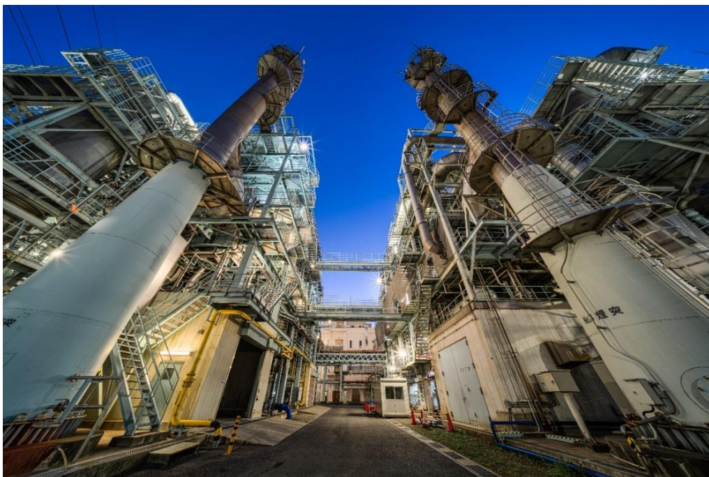
会場：新河岸川水循環センター