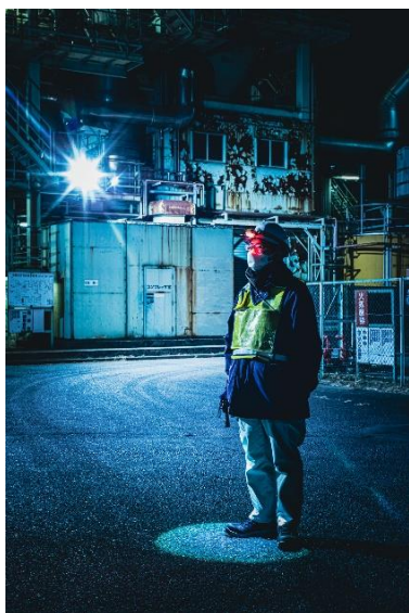
会場：元荒川水循環センター