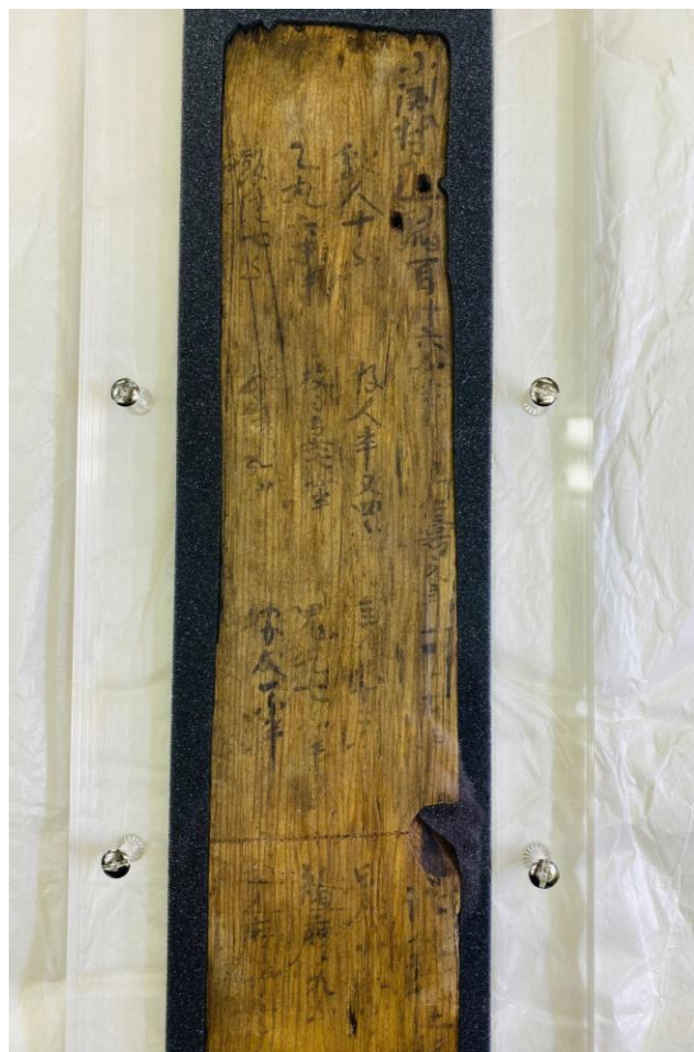
⑨第1号木簡（裏）