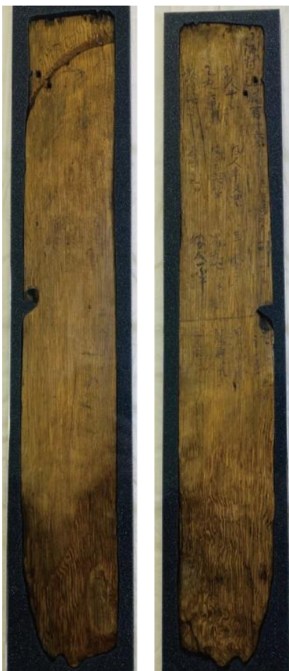
⑧第1号木簡（表・裏）