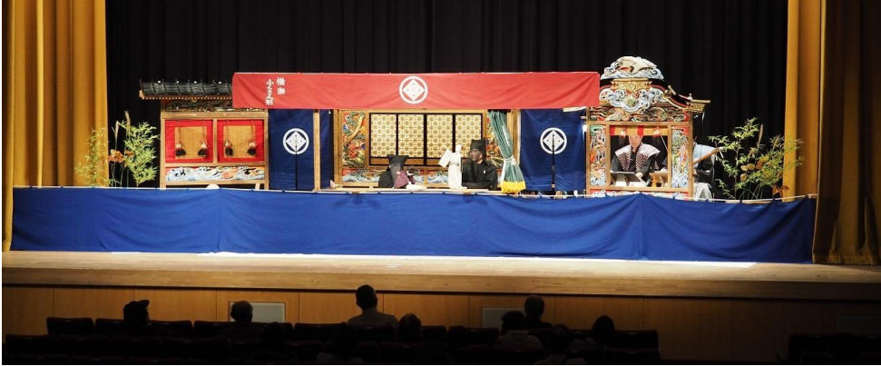
①横瀬の人形芝居舞台 全体