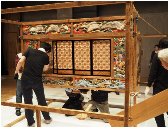
②舞台の組み立て（回り舞台）