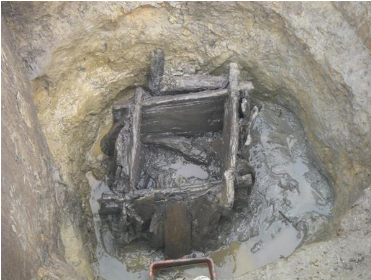
⑦第1号井戸跡、井戸枠検出状況