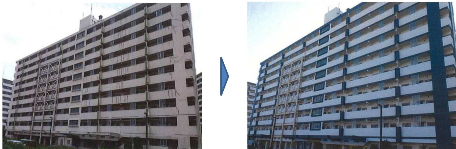
県営所沢パークタウン武蔵野住宅外壁改修工事