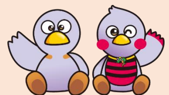
コバトン さいたまっち