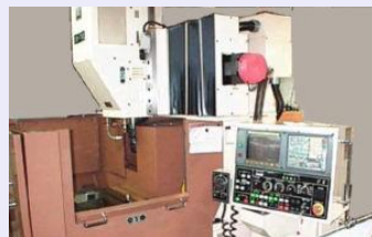
工作機械の製造・開発