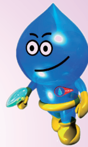
埼玉県営水道のマスコット 「ウォー太郎」