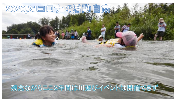
2020,21コロナで活動自粛