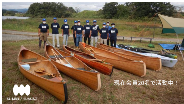
現在会員20名で活動中！