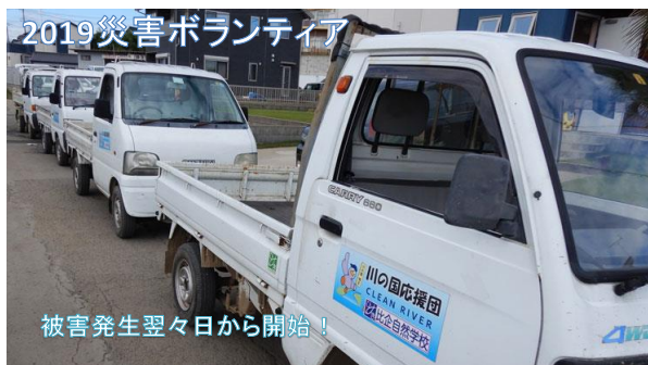
2019災害ボランティア