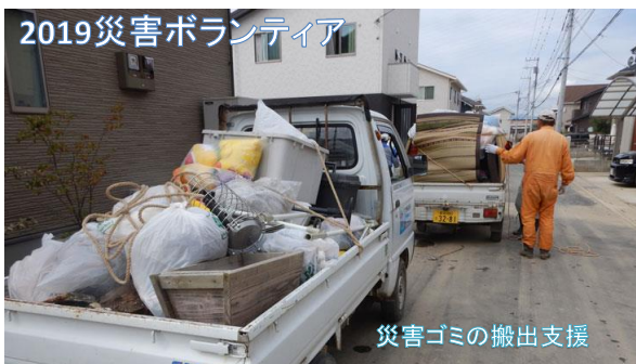
2019災害ボランティア