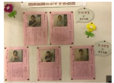
【図書委員による「おすすめの本」の紹介】