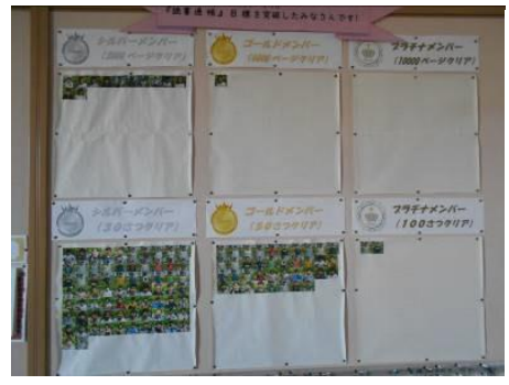
シルバーメンバー・ゴールドメンバー・プラチナメンバーが廊下に貼り出されている。