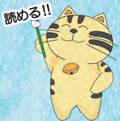
埼玉県立文書館マスコット もんじろう

当講座は、「関心はあるけど読み方がわからない」 「自分で史料を読んでみたい」といった、 これから古文書を読み始める方のための入門講座です。