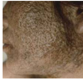
図3. 塩素ニキビ・黒色面皰