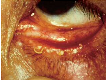
図2. マイボーム腺分泌過多

油症の急性期には、全身倦怠感、食欲不振、体重減少、頭重感といった全身症状や、著明なマイボーム腺の分泌亢進（図2）、眼瞼の浮腫、結膜の充血、視力の低下といった眼症状が起こり、引き続いて塩素痤瘡（塩素ニキビ）とよばれるダイオキシン類中毒に特徴的な皮膚症状：痤瘡様の丘疹、黒色面皰、嚢腫、色素沈着（図3、図4、図5）を始め 注1 、多汗症、喀痰 注2 、咳嗽（せき）、関節痛、頭痛、腹痛、四肢のしびれ、知覚鈍麻、月経異常などの症状がみられました。