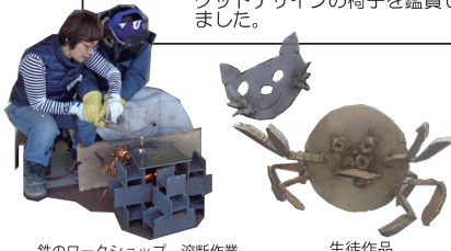
鉄のワークショップ 溶断作業