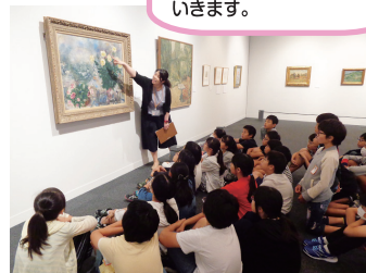
○展示室内 対話による鑑賞の様子