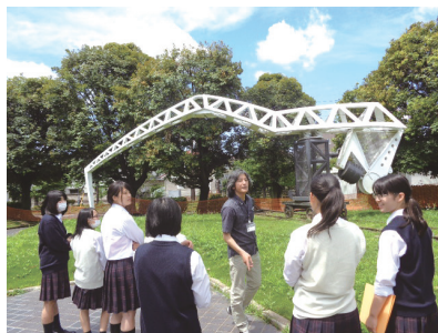
○屋外彫刻 対話による鑑賞の様子

子供と一緒に美術館デビュー！「対話による鑑賞」で 作品の楽しみ方を知り、椅子体験やワークショップで 美術館を満喫。美術館では、土曜日に鑑賞と制作一体型の ワークショップも実施していますよ♪