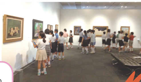
○展示室内 見学の様子

いろいろな作品をみたい！企画展をみたい！ そんな美術部にスタッフが見どころを紹介！ 自分の制作のヒントが見つかるかも。 普段は入れないところも特別にご招待！