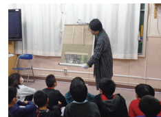
○「日本画って何だろう」授業の様子