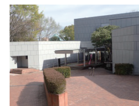
嵐山史跡の博物館外観