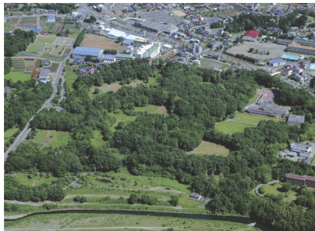
国指定史跡菅谷館跡