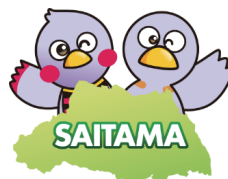
埼玉県のマスコット 「さいたまっち」・「コバトン」