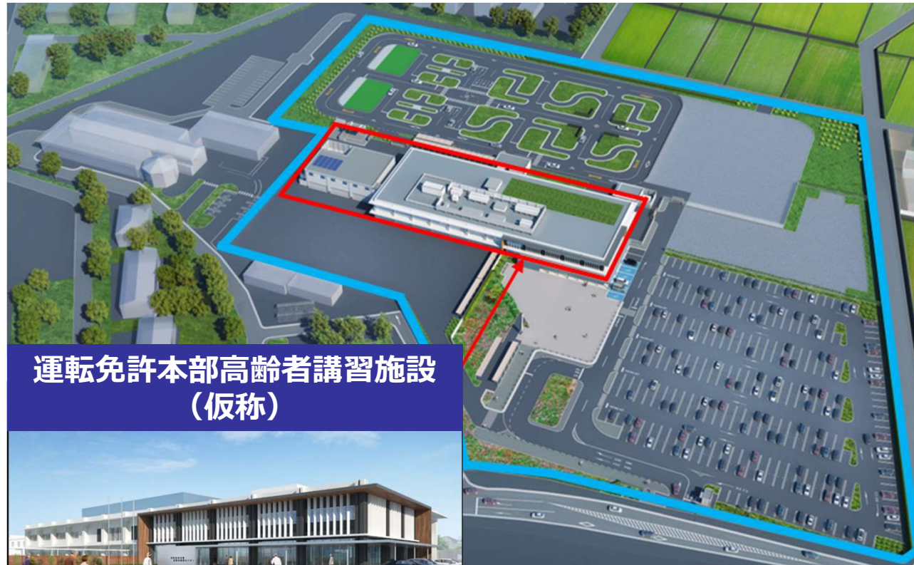
運転免許本部高齢者講習施設 (仮称)