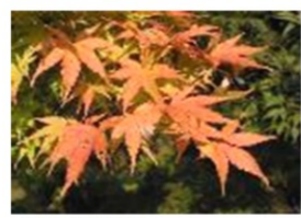
珊瑚閣(さんごかく)