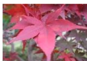
大盃(おおさかずき)