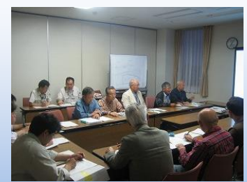
第1回ワークショップ

地域活動 ・越谷市郷土研究会が「郷土歴史散策」を通じて市民に市の文化遺産のPRを実施している。