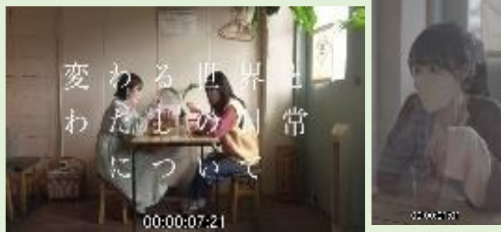
インストリーム広告動画