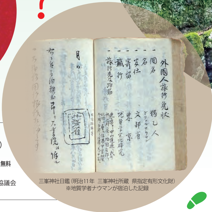
三峯神社日鑑 (明治11年 三峯神社所蔵 県指定有形文化財) ※地質学者ナウマンが宿泊した記録