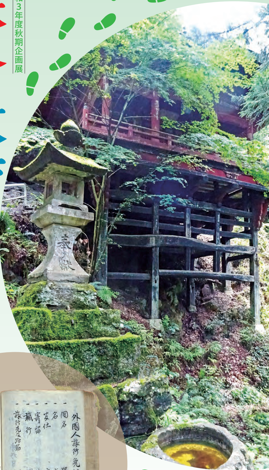
札所 26 番円融寺岩井堂