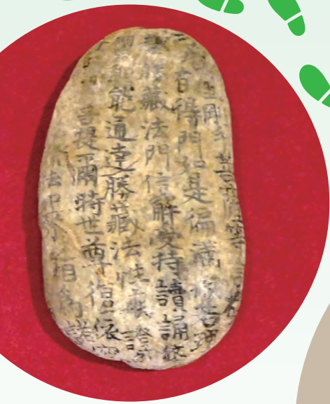
廣見寺から武甲山御嶽神社に奉納された石經 (横瀬町歴史民俗資料館所蔵)

一般 410円 (240円) 学生・高校生 200円 (120円) ※( ) 内は20名以上の団体料金 ※中学生以下、障害者手帳等をお持ちの方は無料