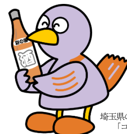
埼玉県のマスコット 「コバトン」