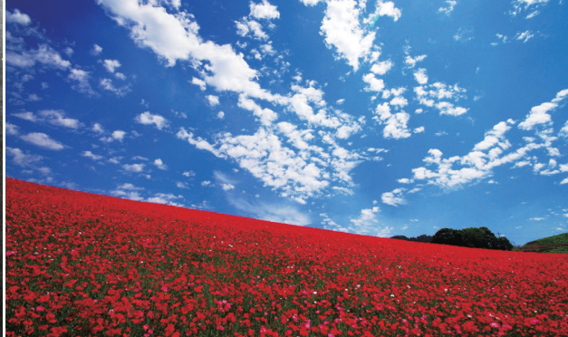
天空のポピー(皆野町・東秩父村)