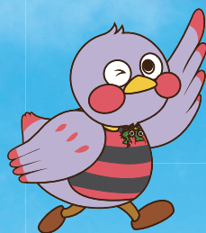
埼玉県のマスコット 「さいたまっち」