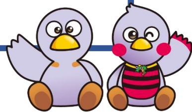
「コバトン」「さいたまっち」

第 68 回精神保健福祉全国大会事務局 (埼玉県疾病対策課精神保健担当) TEL : 048-830-3565 E-mail : a3590-13@pref.saitama.lg.jp