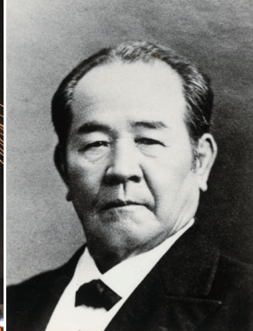
澁沢栄一