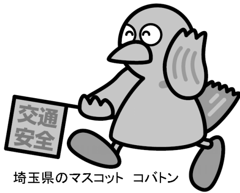
埼玉県のマスコット コバトン