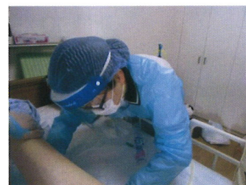
訪問看護ステーションおおみち (大阪府)