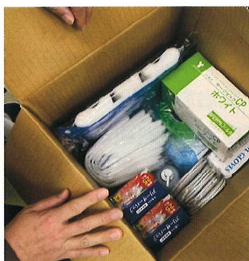
K訪問看護ステーション (D県)