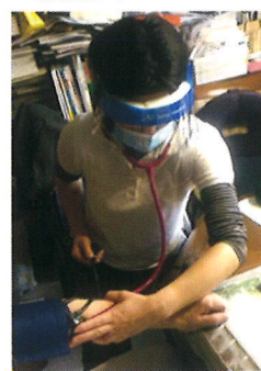
おもて参道訪問看護ステーション (東京都)