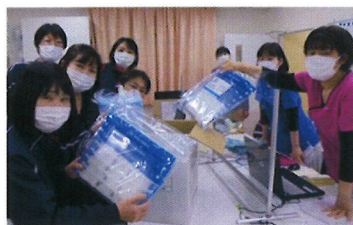
訪問看護ステーション喜 (静岡県)