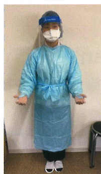
訪問看護ステーションハートフリーやすらぎ (大阪府)