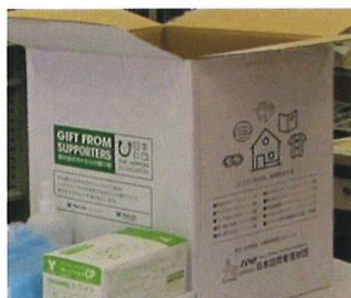
N訪問看護ステーション (S県)